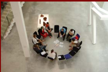
Interaktive Foren boten Raum für Diskussion ...