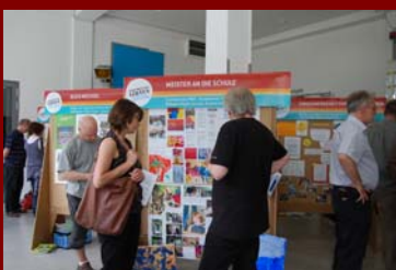
Besucher in der Ausstellung der Modellpartner