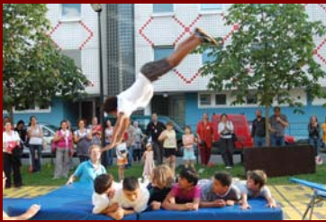
Begeisterte mit bewegtem Abendprogramm: Der Jugendzirkus „Shake!“