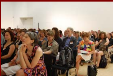
Fachpublikum aus Kultur, Schule, Politik u. Wissenschaft