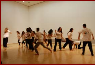
Den künstlerischen Auftakt gestaltete TanzZeit gemeinsam mit der Klasse 6a der „Grundschule am Teltowkanal“ aus Berlin.