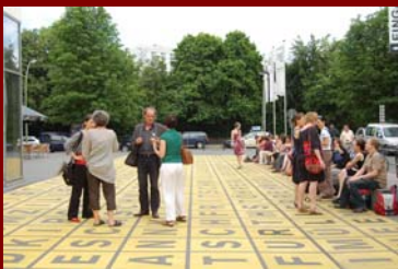
Reger Austausch der Tagungsteilnehmer/innen rund um die Berlinische Galerie