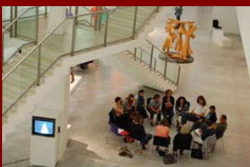
... und kreative Impulse.